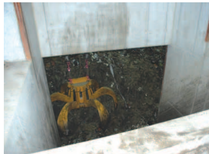
Operaatoriruumist juhatakse käppa, millega prügi koldesse tõstetakse.