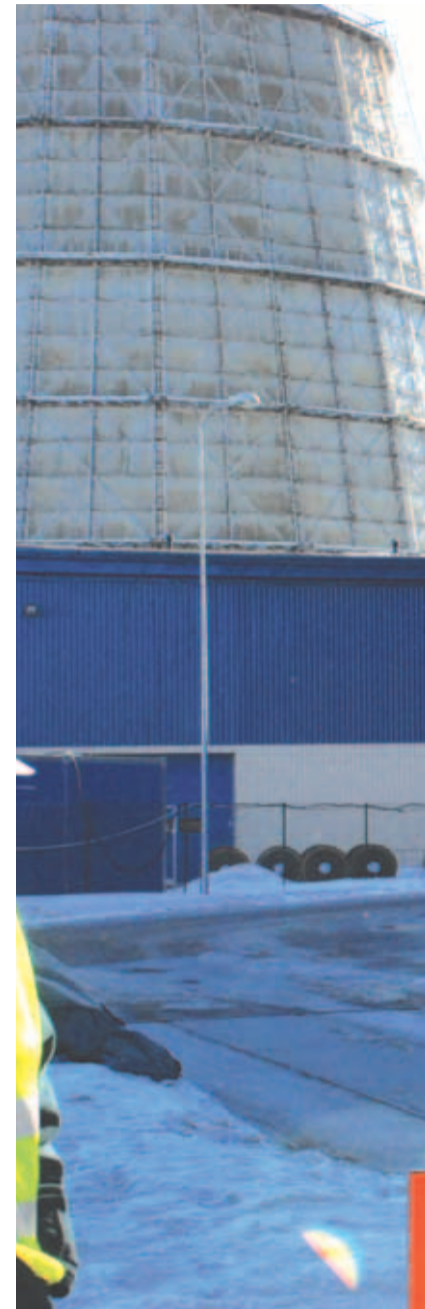
Kõik saabuval ja lahkuval masinad kaalu-

Iru jäätmeploki pidulik avamine leiab aset käesoleva aasta juulis.