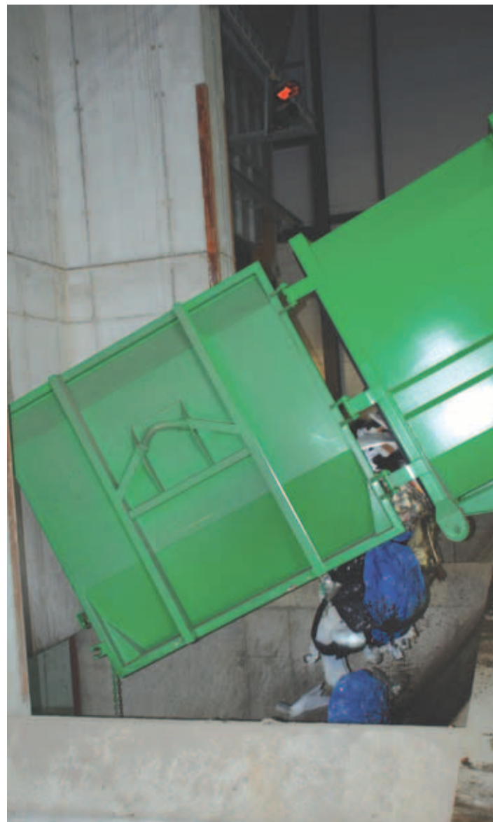
Kohaletoodud prügi valatakse masinatest hoidlasse.