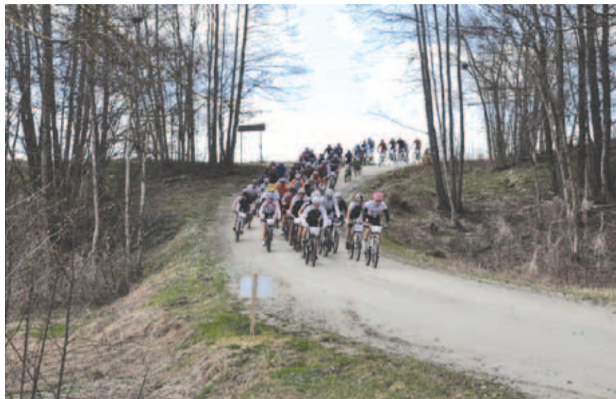
Jõelähtme rattamaraton on kiiresti populaarsust kogunud.

• 15.03 kell 11.17 sõitsid päästjad Kostivere alevikku. Süttinud oli kahekordse elumaja korstnajauga ümbritsev soojustus. Abi saabumise ajaks oli hoone omanik tule vahelagedesse levimisele ämbri vee ja pulberkustutiga piiri pannud. Soojustuse lõplikuks kustutamiseks lammutati umbes ruutmeetri jagu põrandat. Tulekahju arvatav põhjus oli ülekütmise. Hoolimata jõudsalt lähenevast kevadest on ööd külmad ning ülekütmisest alguse saada võivate põlengute oht päevakorras.