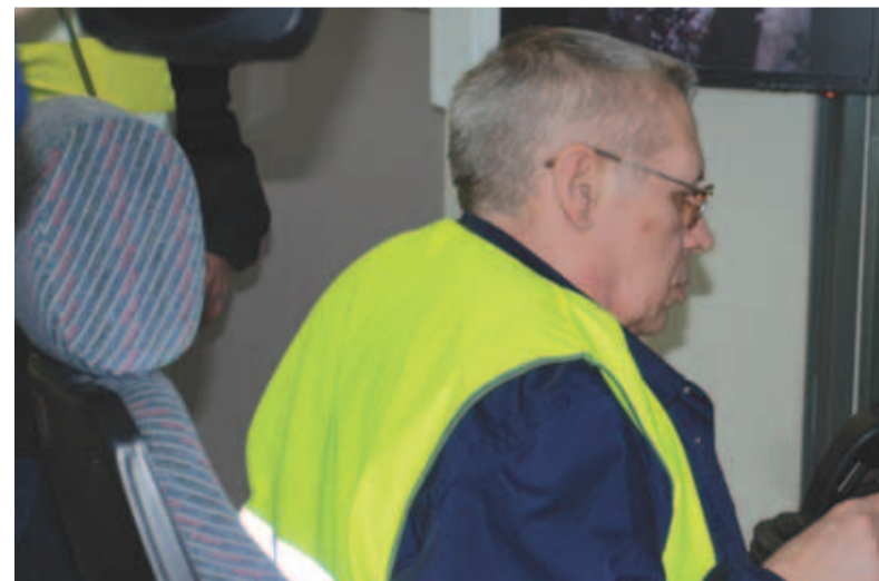
Operaator ees laiub vaateaken hoidlasse, kus ta näeb enda juhitava käpa liikumist kontrollida prügi liikumist koldesse.