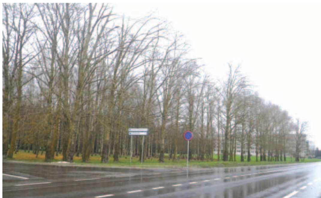
Loo aleviku likvideeritud paplid.