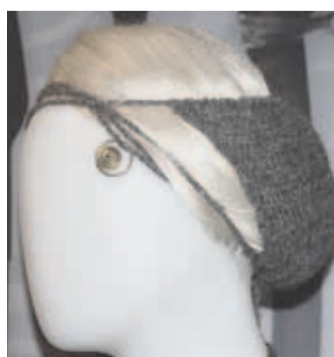
Pronksiaegne oimuehe kaunistas tolleageid naisi.

Siinkohal kasutan võimalust teha üleskutse inimestele, kes tahaksid ürituse korraldamises vabatahtlikuna kaasa lüüa. Kuna matkale on oodata hulgaliselt inimesi väljast poolt Jõelähtme valda, oleks tore kui leiduks inimesi, kes tahaksid aidata kohalikke väärtusi tutvustada. Pakun omalt poolt algatuseks 7. aprillil ekskursiooni Jägala linnamäel, algusega keskpäeval. Kõik huvilised on oodatud!