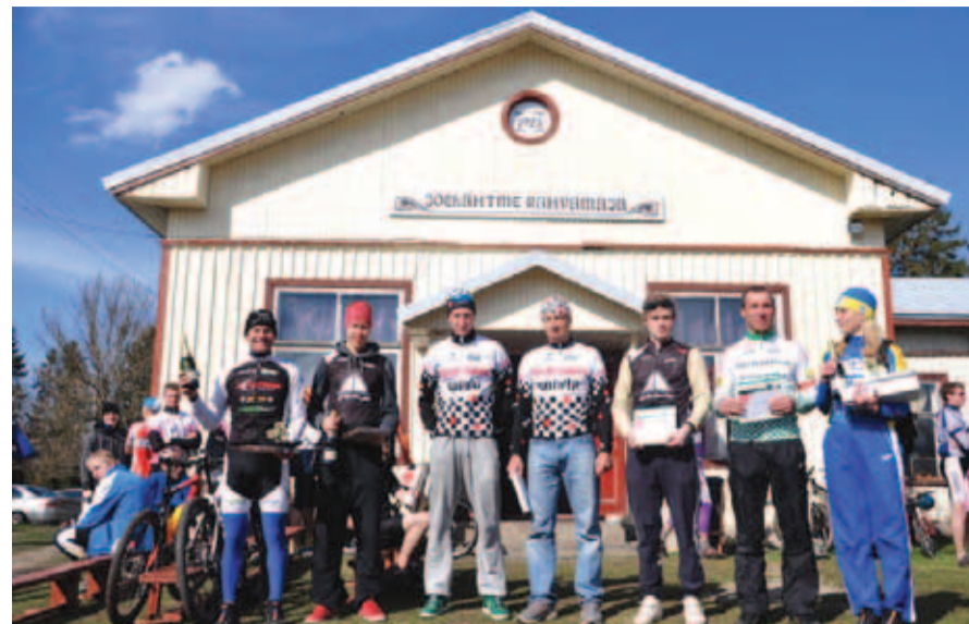
Jõelähtme VI rattamaratoni tublimad.