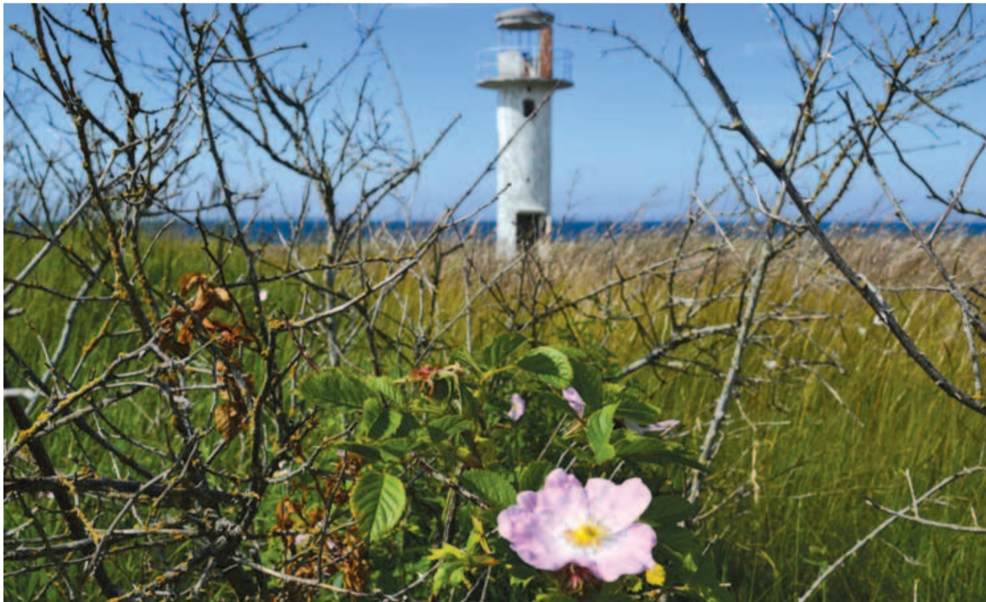
Neeme küla postkaardi konkursi võitnud foto.