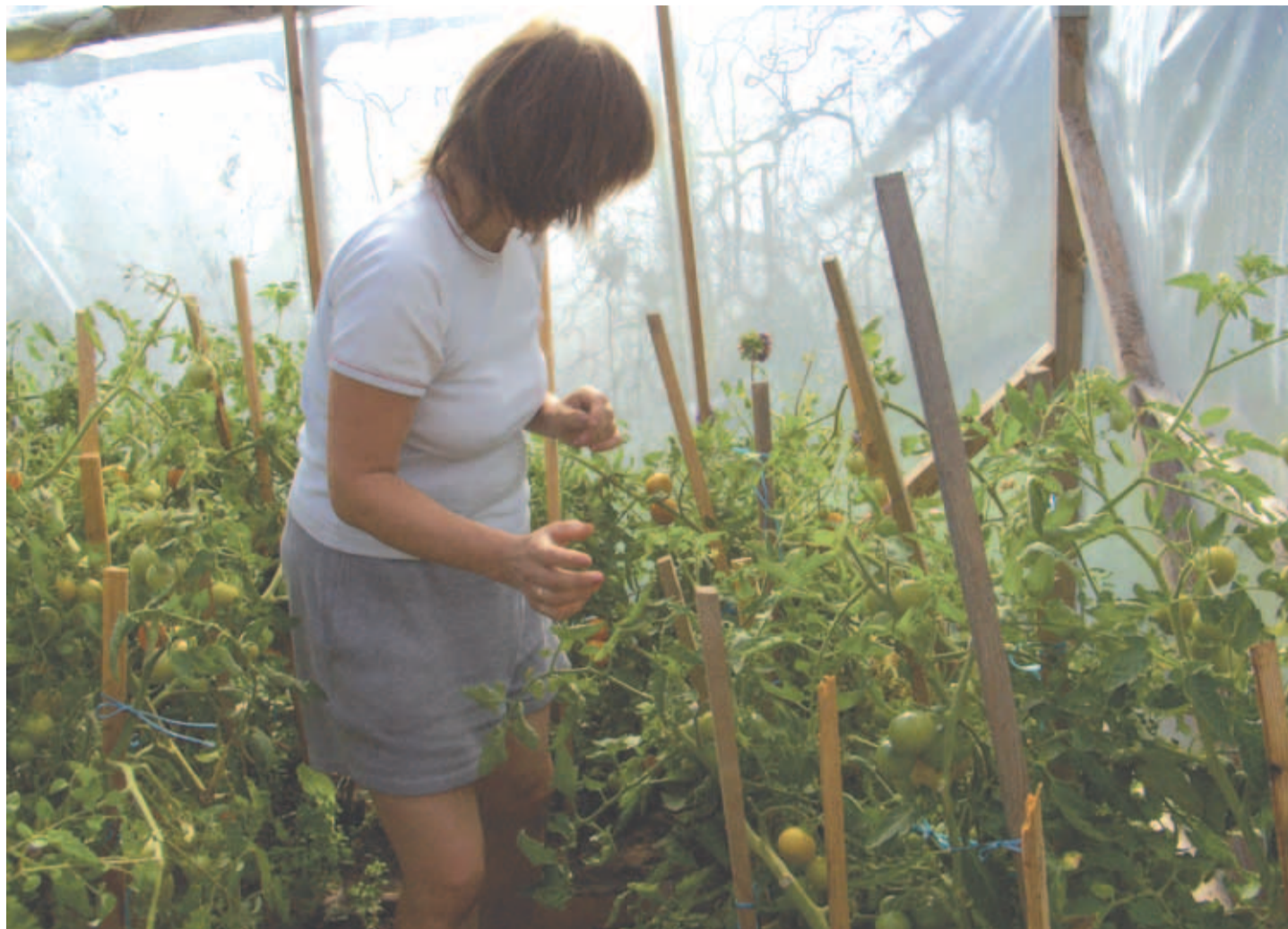
Need tomatid on kindlasti parema maitsega kui supermarketist ostetud.

Selleks, et Elioni teenuste kohta rohkem infot saada või neid oma koju või ettevõttesse tellida, võib helistada klientide teenindusse numbril 165. Lisainfot saab internetist aadressil www.elion.ee. Kiire internet jõuab kodudeni Elioni ja projekti Estwin arenduste tulemusena.