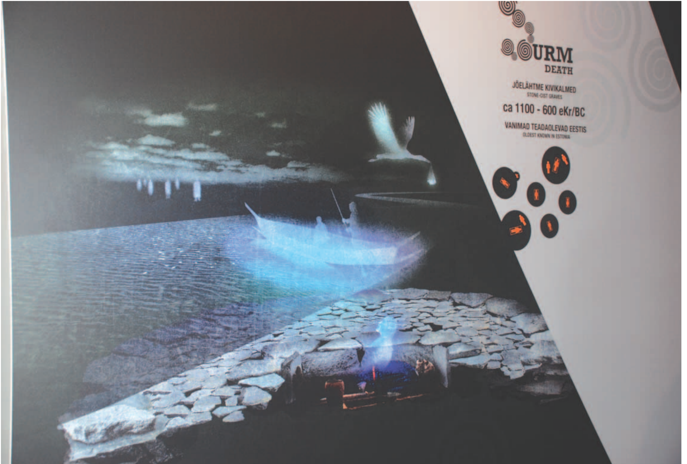
Uskumuste kohaselt ületab siit ilmast lahkuv inimene hingena Toonela jõe ning mõned usuvad, et toonekurg toob lapsi. "Eluring" Rebala muuseumi seinal.